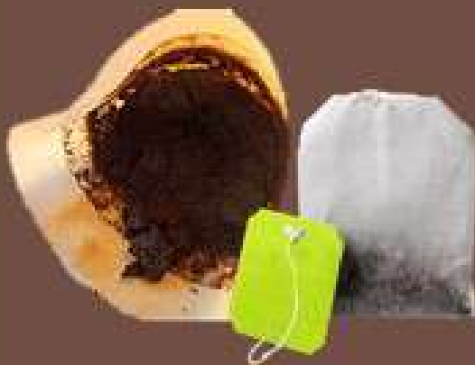
Marc de café, sachets de thé