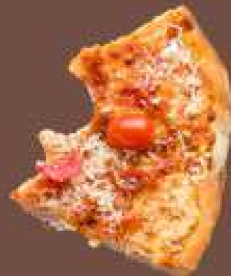
Restes de repas

IPNS – ne pas jeter sur la voie publique