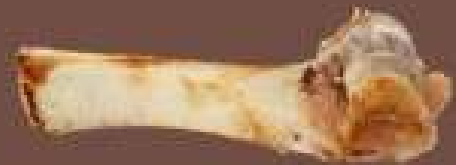
Restes de viande, de poisson et petits os