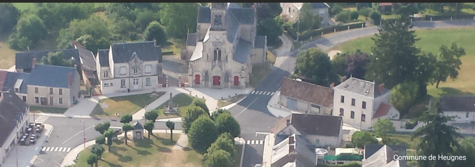
Commune de Heugnes

LA LETTRE D'INFORMATION DU PAYS DE VALENÇAY EN BERRY