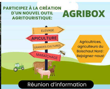
16 janvier - Lancement du projet Agribox