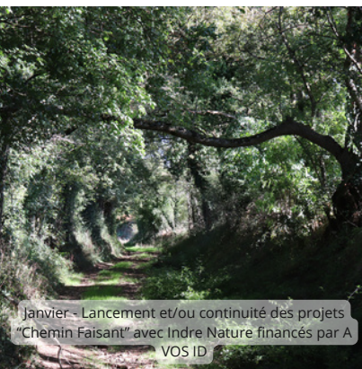
Janvier - Lancement et/ou continuité des projets "Chemin Faisant" avec Indre Nature financés par A VOS ID