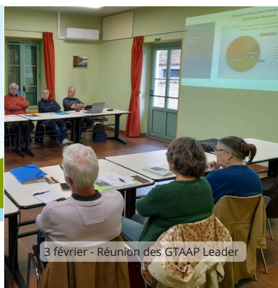
3 février - Réunion des GTAAP Leader