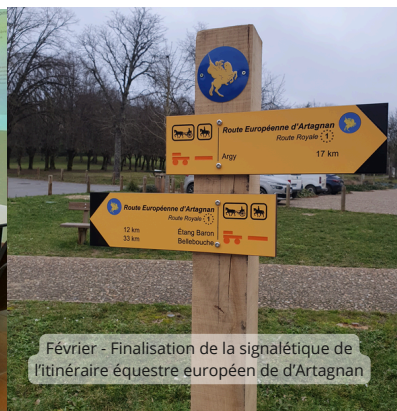
Février - Finalisation de la signalétique de l'itinéraire équestre européen de d'Artaignan